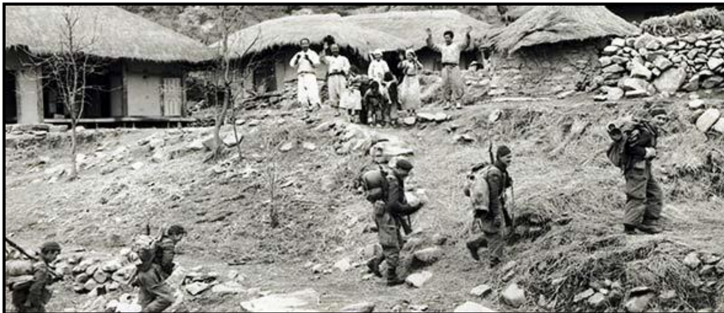
Troupes du 2 e Bataillon du régiment Princess Patricia's Canadian Light Infantry au cours d'une patrouille, mars 1951. (Photo : Bibliothèque et Archives Canada PA-115564 du Sud. Février-Mars.)

Les hommes politiques occidentaux débattent de la question de franchir la frontière chinoise. Ils décident d'y renoncer fin avril 1951 mais pendant ce temps les forces chinoises et nord-coréennes, ayant reçu des renforts de troupes et de matériel, attaquent les secteurs ouest et centre-ouest. L'avancée des Chinois force les troupes américaines du secteur à battre en retraite. Les troupes canadiennes et celles des autres pays du Commonwealth se joignent au combat dans la vallée de la Kapyong, où elles aident les Américains à se replier et à se mettre en sécurité. On octroya aux Canadiens la citation présidentielle américaine pour cet acte de bravoure.