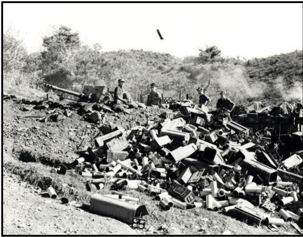
Les canons de la batterie « A » de la RCHA tirent sur les troupes chinoises qui attaquent les positions de la Compagnie

Assaillis par un feu nourri et les lignes de communication rompues, les Canadiens doivent abandonner leurs positions de défense devant l'afflux de l'adversaire. L'ONU réplique par un tir de chars et de mortiers sur les secteurs capturés. Les Chinois se sont repliés, et les Canadiens ont repris la cote aux petites heures du matin le 24 octobre. Les Canadiens ont essuyé de lourdes pertes 18 soldats tués, 35 blessés et 14 faits prisonniers.