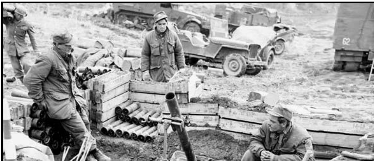
Un peloton de mortier du Royal 22 e Régiment, prêt à tirer. Novembre 1951.

Le 22 novembre 1951, les troupes canadiennes du Royal Canadian Regiment , du Princess Patricia's Canadian Light Infantry et du Royal 22 e Régiment sont affectées à un nouveau secteur de la ligne de front mesurant à peu près sept kilomètres. Ce secteur longe la cote 355, qui appartenait alors aux Américains.